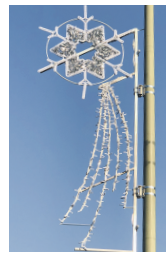
Bald schon brennt die Beleuchtung.

Es waren ambitionöse Ziele, die sich Lucas Wüss, der Motor der neuen Weihnachtsbeleuchtung und Vorstandsmittglied des Gewerbeverein Oberwil / Biel-Benken im Frühjahr für diesen Advent gesteckt hatte. Von den 90 in die Jahre gekommenen Sterne war sein Ziel deren 50 zu ersetzen. In Auftrag gegeben hatte es der Vorstand, resp. die Generalversammlung des GVÖB mit der Initialzahlung von 12'500 Franken aus dem eigenen «Kasseli». Und dazu gesellte sich die sehr grosszügige Beteiligung der Gemeinde Oberwil von maximal 40% der Anschaffungskosten. Die Basis für eine neue Weihnachtsbeleuchtung war also bereits im Frühsommer 2018 gelegt.